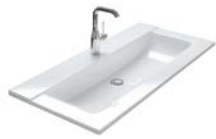
KERAMIEK 610 | 810 | 1010 | 1210 | 1410 MM

460 MM DIEP | 1 WASTAFELBLAD | 8 WASTAFELKASTEN